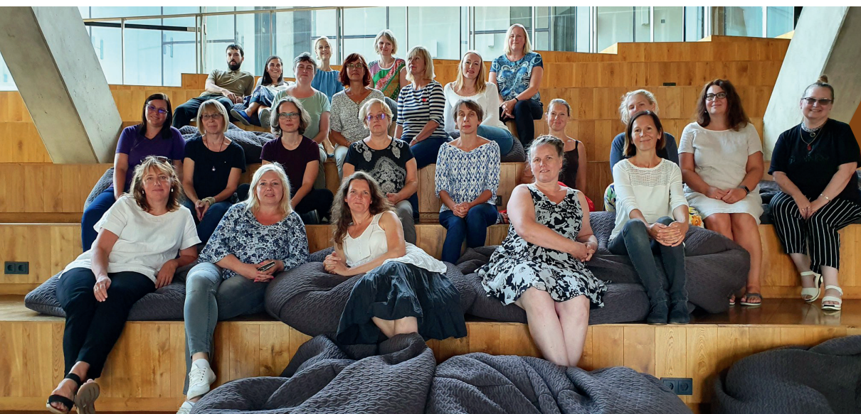
Suvepäevalised Tartu Ülikooli Narva Kolledžis.