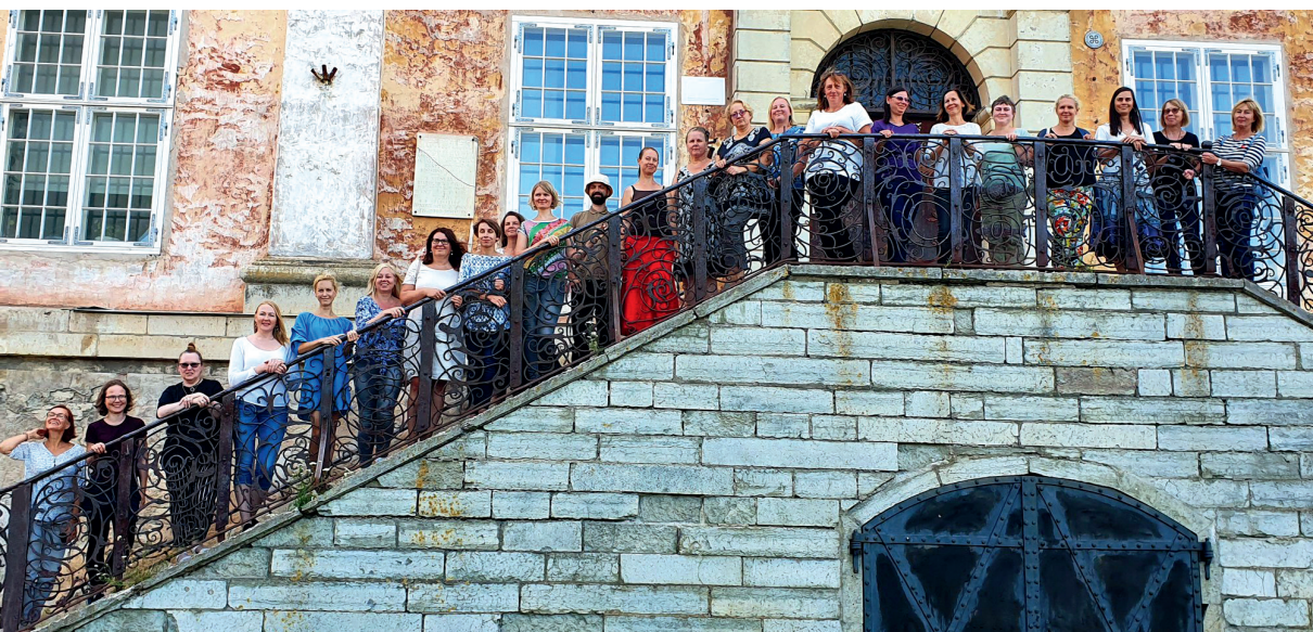
Suvepäevalised Narva raekoja trepil.