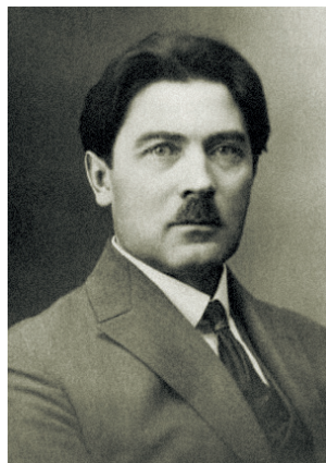
Johannes Aavik